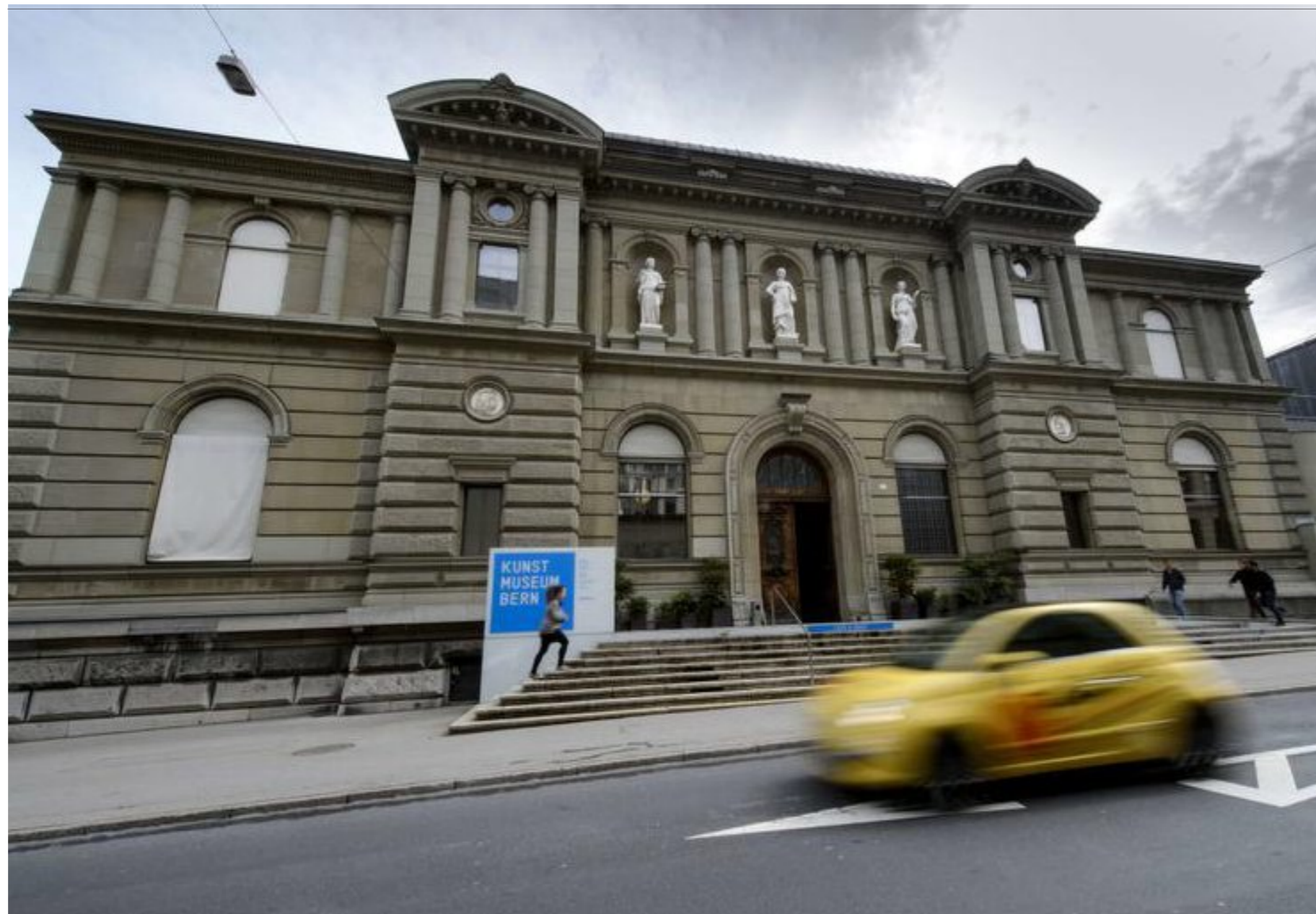
Endstation einer Odyssee: Erweist sich das Berner Kunstmuseum als würdiger Erbeher des Bilderschatzes von Cornelius Gurlitt?